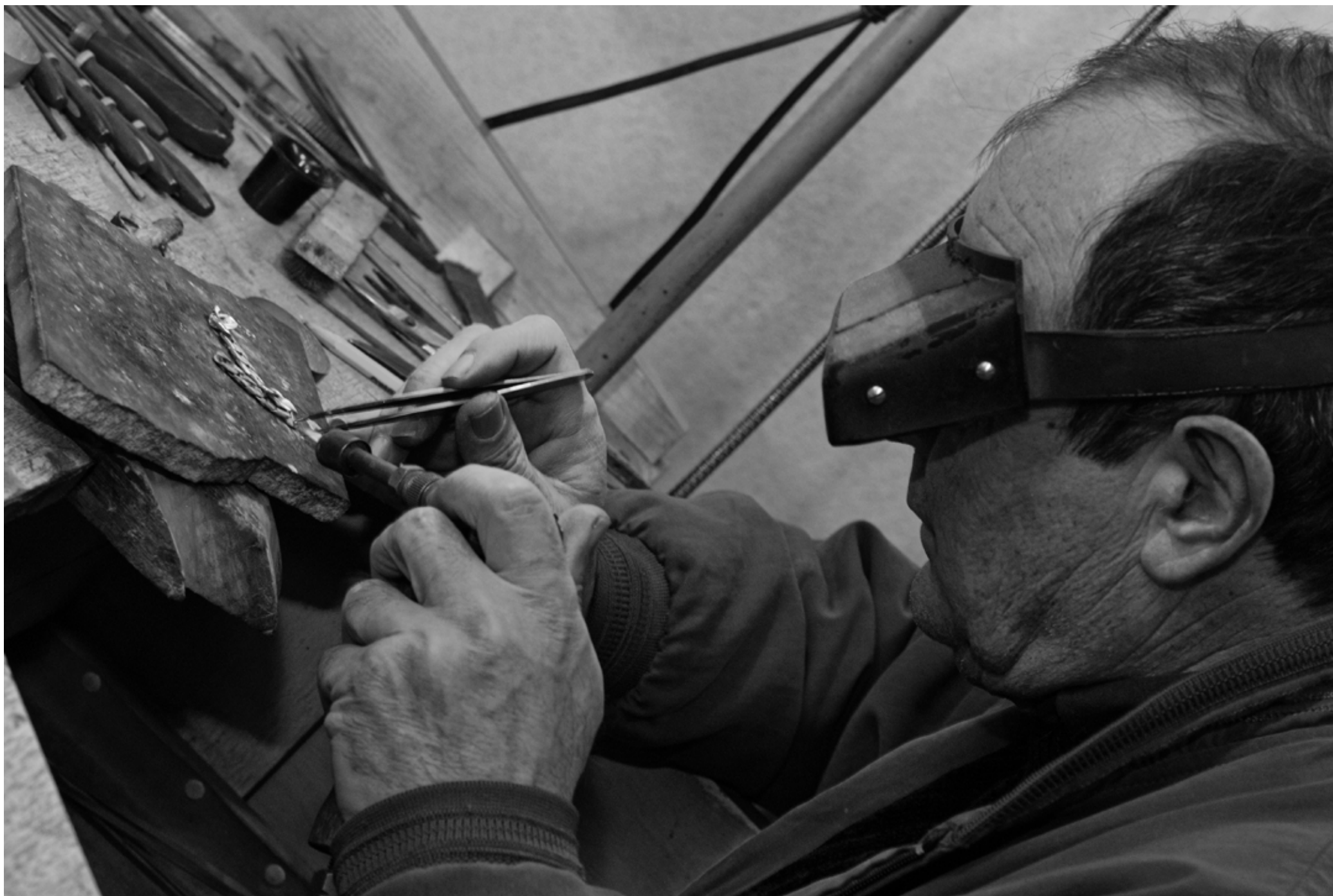
Ръцете на златаря