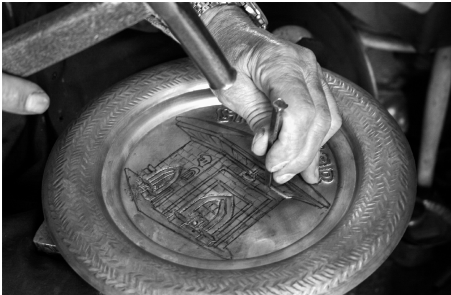
Майстор Добри ръчно гравира на бакърена паница „Голямата чешма“ в Самоков